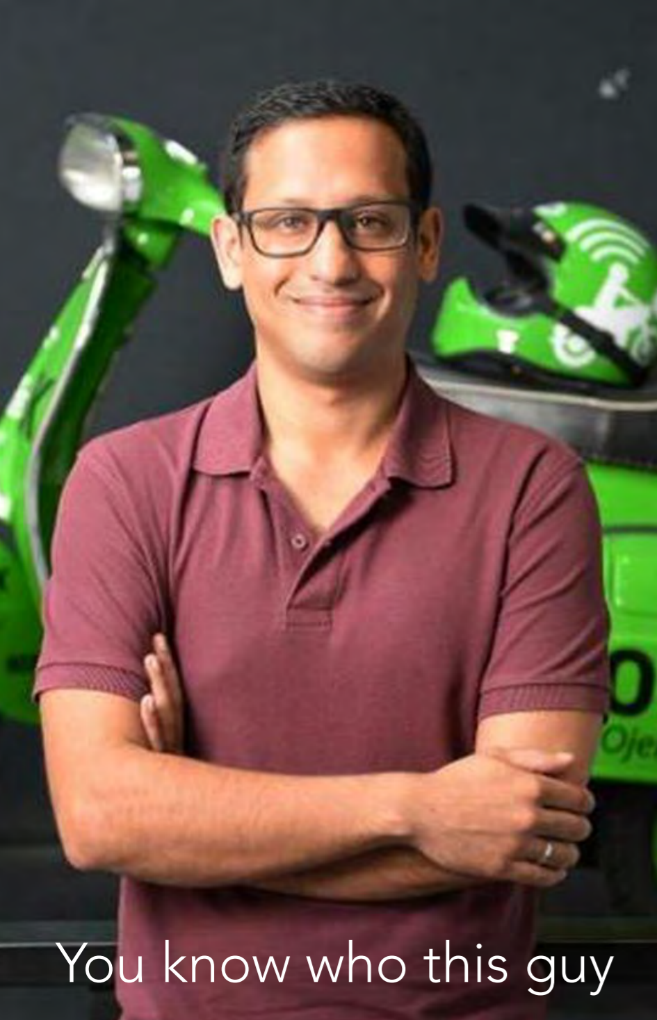
You know who this guy