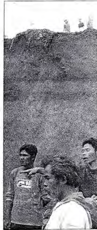
POHON DITEBANG -Tebing setinggi meter longsor menimpa rumah di ba

kecil lagi di bagian situ, kata ny. sembari menunjukkan arah lor. Ditambahkan Slamet, tanaman tanah yang longsor itu belum ditebang. Kemudian tanah milik itu dicangkul akan ditanami. (lis)