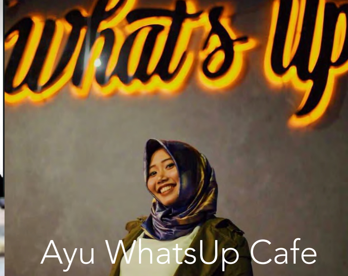
Ayu WhatsUp Cafe