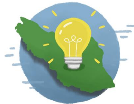
Mengembangkan sistem rekrutmen guru honorer di Kota Bukittinggi