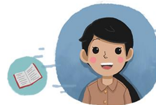
Kisah menjadi guru baru di Indonesia