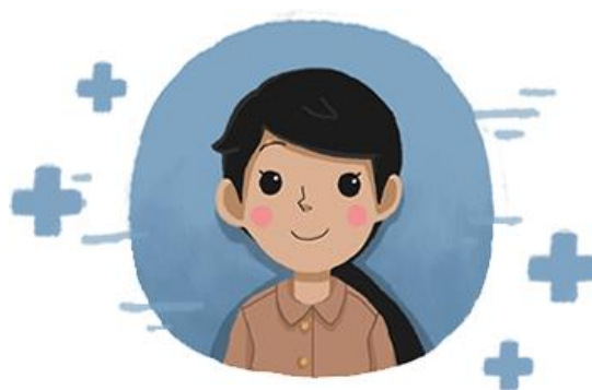
Tunjangan atas Kinerja Guru