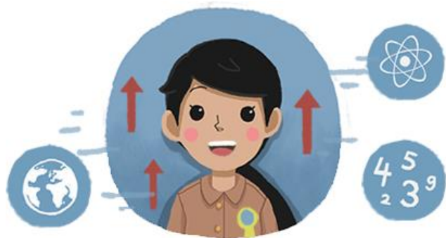
Pengembangan Keprofesian Berkelanjutan (PKB)