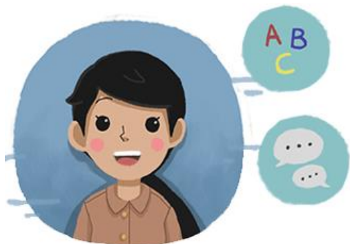
Pendidikan Profesi Guru (PPG) Prajabatan